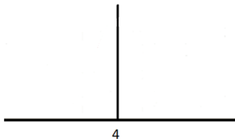
valore senza incertezza

Nel caso di un risultato di 4 con un'incertezza di \pm 1 :